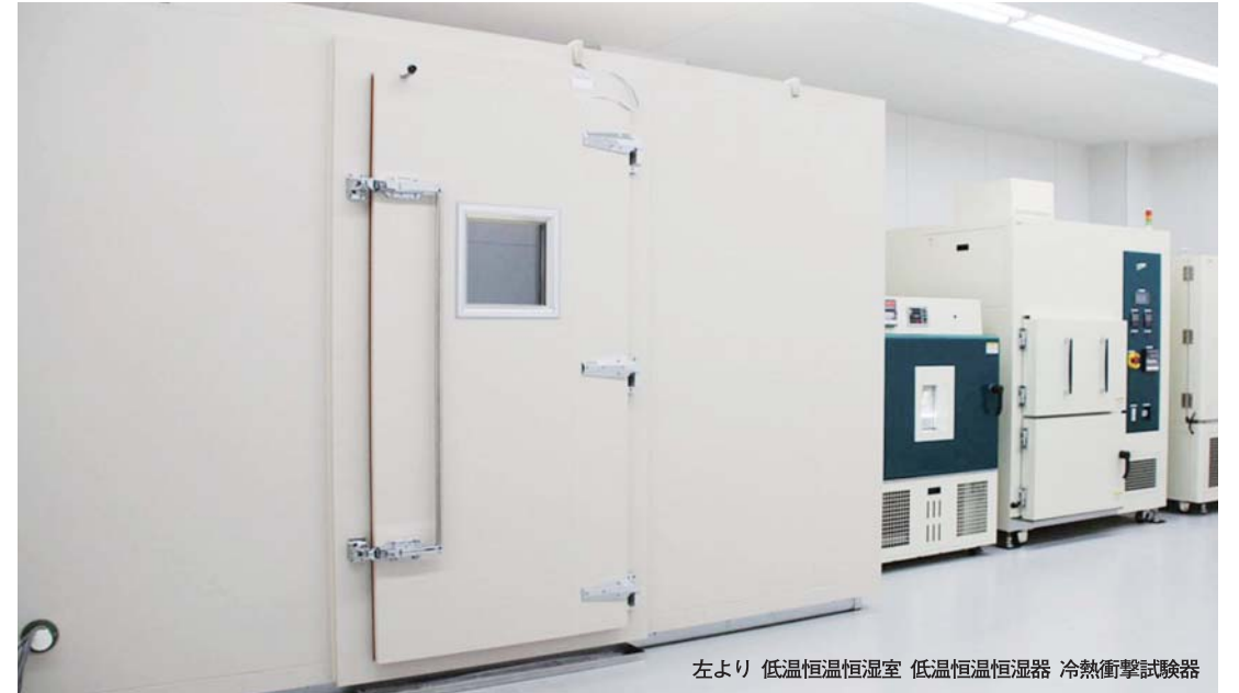
左より 低温恒温恒湿室 低温恒温恒湿器 冷熱衝撃試験器

品質への取組み 賛光電器産業の商品は、JIS規格、JIL規格に準拠、社内試験装置により品質管理を行っています。