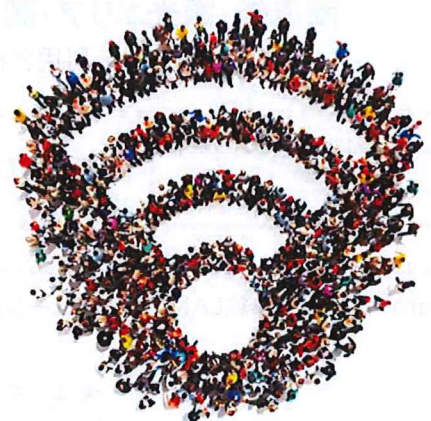
公衆Wi-Fi提供マーク(例)